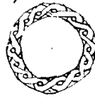
כת"י הספריה הלאומית, פריז 1218 heb.